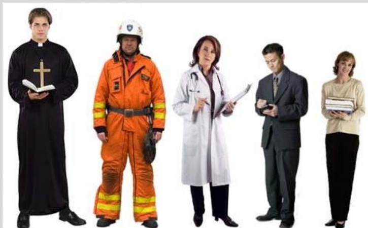
Священнослужители 87% Пожарные 80% Физиотерапевты 78% Писатели 74% Учителя 70%

Наибольшее удовлетворение от работы приносят такие профессии: